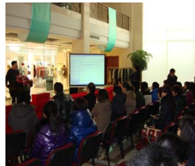
店长进修培训会现场