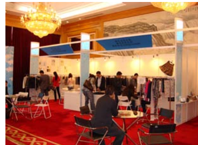
深圳「日本高级面料展」 2009年12月