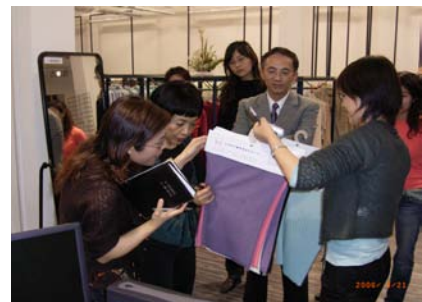
家进行商品、样品评定会